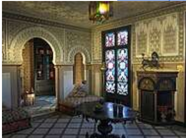
Le salon mauresque restauré du château de Monte Cristo.

À l'intérieur, le rez-de-chaussée abrite des salons et la salle à manger, pièce centrale pour Dumas gastronome et cuisinier, tandis qu'au premier étage on trouve alors la chambre, la bibliothèque, le cabinet de toilette et le fameux salon mauresque 2 .